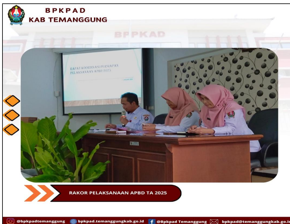
Gambar 3. 1 Rapat Koordinasi Pelaksanaan APBD TA 2026

Berikut adalah dokumentasi kegiatan yang menunjang pencapaian kinerja sasaran ini: