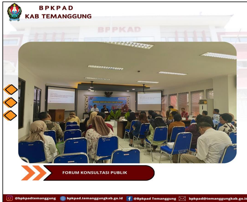
Gambar III. 1 Forum Konsultasi Publik Terkait Pajak Daerah

Berikut dokumentasi kegiatan yang menunjang keberhasilan indikator sasaran ini: